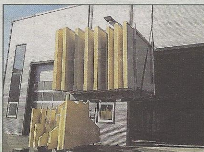
Dämmungen fertig zugeschnitten

Daten werden automatisch an die Produktion übertragen. Digital wird dann das Fassaden-Design entworfen und die Fertigteile werden letztlich vor Ort per patentierter Schienen-